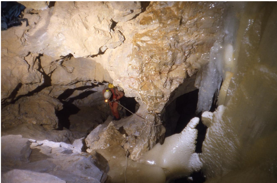
A Pálesz-akna bejárata