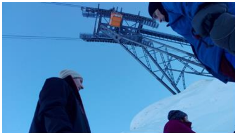
Pont a felvonó alatt van a bejárat, itt kell ásnunk.