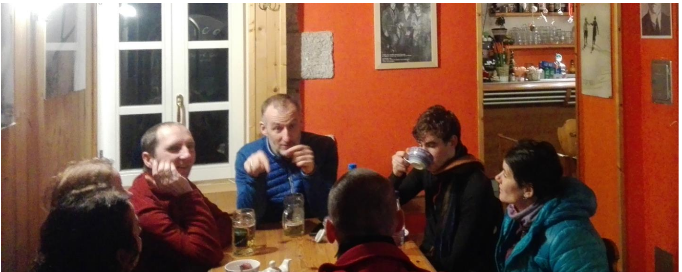
Csak mi voltunk az étteremben, nem zavart minket senki, kezdetét vette a sztorizás.

Első körben a pultnál vettünk egy-egy forralt bort, és bevonultunk a belső helyiségbe, ahol rajtunk kívül nem volt senki. Az étteremben kezdetét vette az esti pálinkázás és sztorizás. A vacsorára, azaz a szakácsra várni kellett, de csak egy órát. A 7,5 eurós leves finom volt, jómagam ettem másfél levest, egy tésztát és a közös vörösborból is ittam egy kicsit.