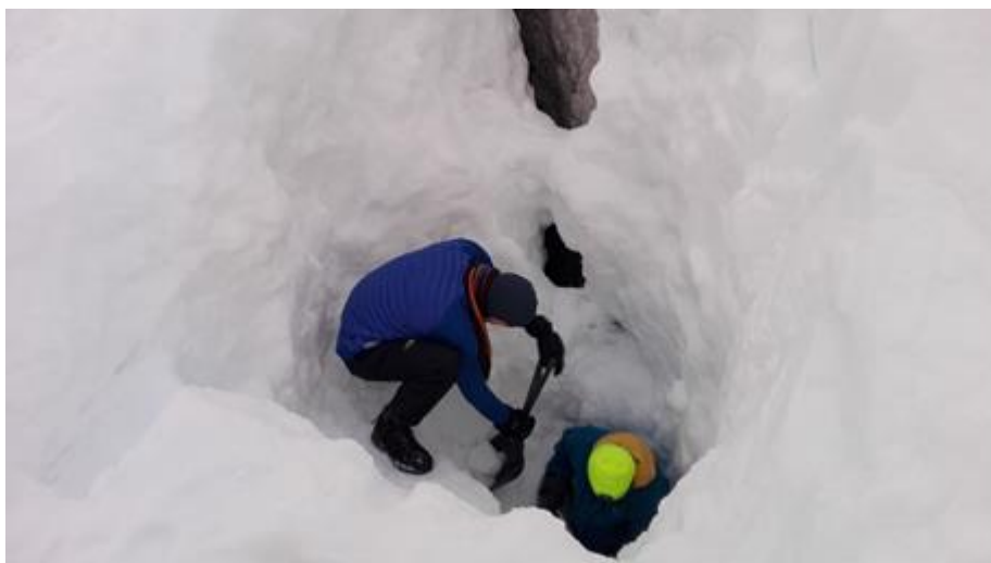
A gödör alján: a belyukadás előtti pillanatok

A viszonylag mély és keskeny gödör alján egy ember tudott dolgozni, és nem sokkal a tábla alatt meg is nyílt a bejárat. Igyekeztünk nagyobb tömböket feladni, melyek még mindig sűrűbb nagy tömbökből álltak, olyanok voltak, mint egy Ytong-tégla, akár iglut is építhettünk volna belőlük. A nagy csendnek a fejünk fölötti felvonó beindításának zaja vetett véget.