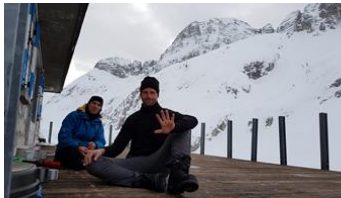
Készülés a teraszon, melynek egyik legfontosabb fázisa: a főzőcskézés és az evés.