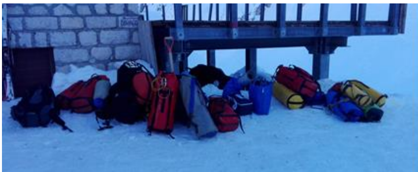
A házhoz érkeve megszabadultunk terhüinktől és a terasz mellett leraktuk a hóra.

Az ásás jól haladt, így, hogy mind a nyolcan ott voltunk nem is jutott folyamatos tevékenység mindenkinek. Ezért cserélgettük egymást, eleinte a felső csoport a szépítéssel, a feldobált hó odább rakásával volt elfoglalva.