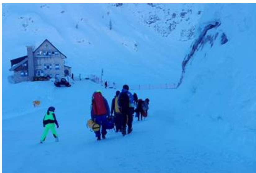
A házig tartó sétánkat egy csodálkozó síelő tekintete követte.

A háznál beültünk egy italra, és cuccok lepakolására megkaptuk az alsó, nem fűtött szobát. Itt úgy döntöttünk, hogy inkább fizetünk fejenként 20 eurót egy szobáért, minthogy 15 euróért egy olyan padlástérben legyünk, ahol fel sem tudunk állni, konnektor sincsen stb.