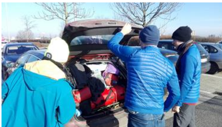
Pakolás a Tesco parkolójában: több cuccot ezután már nem vásárlunk!

Elindultunk, a szombathelyi Decathlon-nál egy cipővásárlást is szeretnénk volna beiktatni, de technikai okok miatt zárva volt, így a közeli Tescóban oldottuk meg a dolgot. A Tesco áruházban sok jó holmi le volt értékélve, ezért mind a négyen vettünk felső részt is. Szombathely szélén lévő MOL-kútnál tankoltunk és folytattuk utunkat Ausztria felé. A nap ragyog, a tiszta és enyhén párás időben már az osztrák Mészkö-Alpok keleti része is látható.