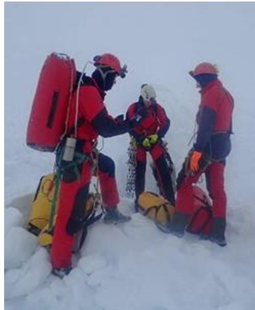
Már beöltözve a bejáratnál: az első csapat épp leszállásra készül.