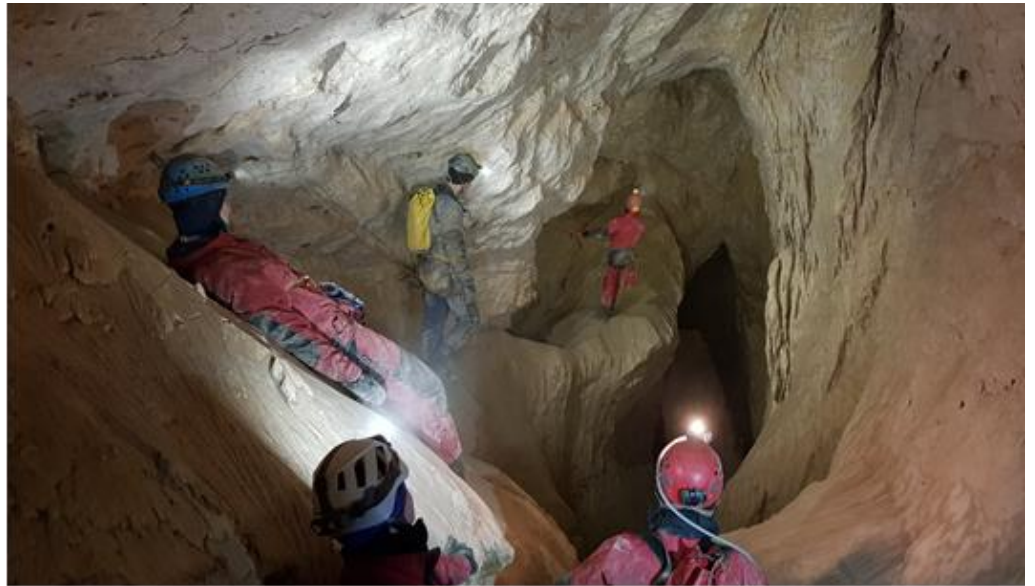
A bivak mögötti oldalág első tágasabb része

Magyar Peti telefonjával készített egy pár igen jó felvételt.