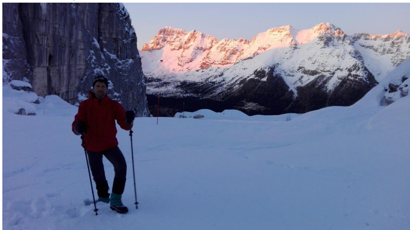
Délután fél ötkor már lemenőben volt a nap, megkezdődött a hófödte csúcsok színjátéka.