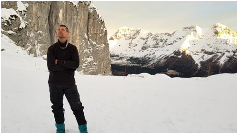
Feltekintés a ház fölött magasodó gerincre

Nagy volt a csend, a táj is aludt, jó volt körültekinteni, látni az óriási behavazott hegyeket, feltekinteni a ház fölötti gerincre. Érezhető volt, mi milyen aprók is vagyunk.