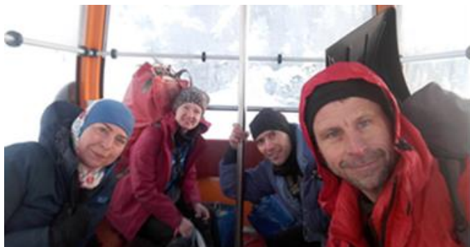
Csak úgy, mint a legutóbbi Caninról lejövő téli barlangtúra után, most is csináltam egy felvételt.