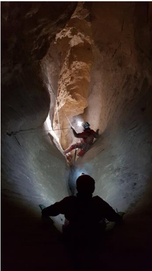
Az oldalág egyik része

Jól aludtunk, nagy volt a csend, senki sem horkolt. A távolabbi víz csobogása sem volt zavaró.